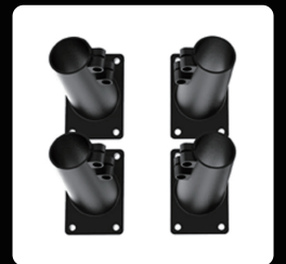
스키드 고정 베이스 *4