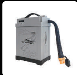
타투22000 스마트 배터리 *1