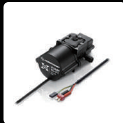
5L 펌프 *2