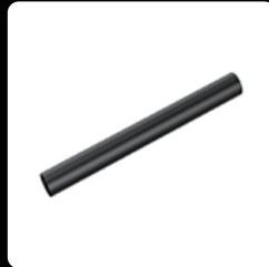
스키드 크로스바 *4