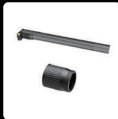
암대 *4 / 소켓 *4