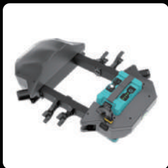
본체 프레임 *1

해당 제품 QR코드를 통해 보다 자세한 정보를 확인해 보실 수 있습니다.