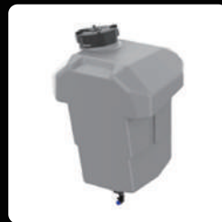
약제통 20L *1