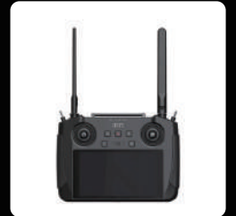
MK15 조종기 *1