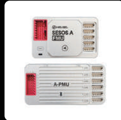
SESOS A *1