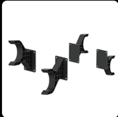
접이식 암대 거치대 *4