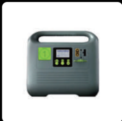
다간 3000H *1