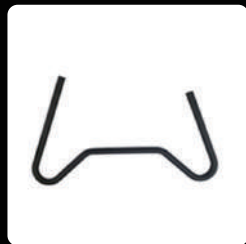
입제 작업에 특화된 스키드 *2