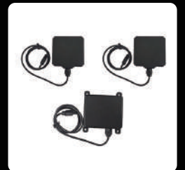
전후방, 고도유지 레이더 *1